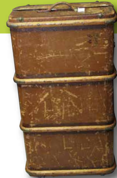
Der Überseekoffer mit zahlreichen Erinnerungen stammt aus dem Heimatmuseum Ebern.

ArbeitsmigrantInnen, die in den Jahren des Wirtschaftswunders nach Deutschland kamen, unterstützten den wirtschaftlichen Aufschwung. Heute gestalten Zugezogene aus vielen verschiedenen Nationen unsere Gesellschaft mit.