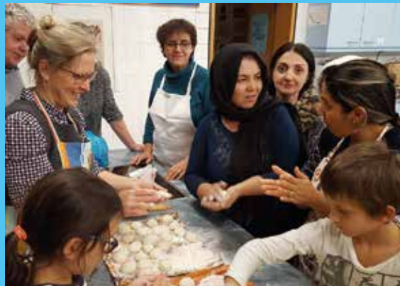
Afghanischer Kochabend in Hofheim

Waren es im 7. Jahrhundert irischottische Wandermönche, die sich in Unterfranken niederließen, gab es nach der Reformationszeit protestantische Glaubensflüchtlinge, welche die Entwicklung zahlreicher Gemeinden prägen.