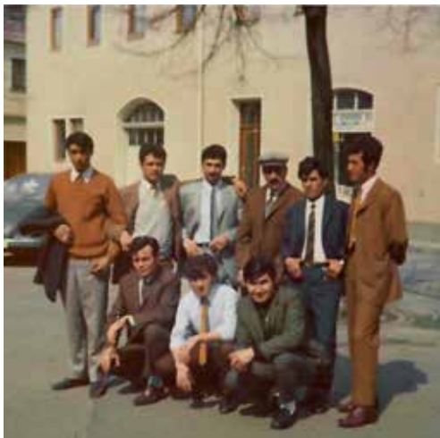
Türkische Arbeitsmigranten auf dem Karlstadter Kirchplatz, 1970

Die Ausstellung des Bezirks Unterfranken zeigt beispielhaft Geschichten aus unterschiedlichen Epochen und macht deutlich, dass Mobilität und Migration seit Jahrhunderten prägende Elemente unserer Gesellschaft sind.