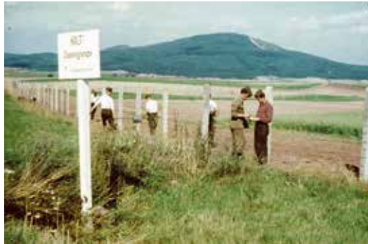
Die innerdeutsche Grenze, die mit den Jahren immer stärker ausgebaut wurde, zerriss Verwandtschafts- und Freundschaftsbande und führte zu zahlreichen Fluchtereignissen.