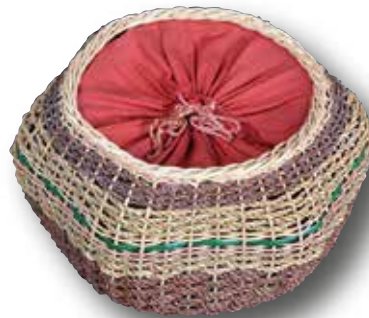
Das Handarbeitskörbchen stammt aus dem Besitz einer Familie aus dem Sudetenland, die sich nach der Vertreibung 1947 in Karlstadt niederließ.